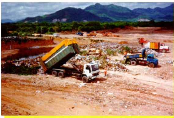
Figura 1 – detalhe de operação no Aterro Sanitário da Região Metropolitana de Fortaleza (ASMOC) em Caucaia-CE.

A figura 1 ilustra um detalhe de operação em um aterro sanitário, enquanto que, na Figura 2, vê-se a preparação da drenagem do percolado.