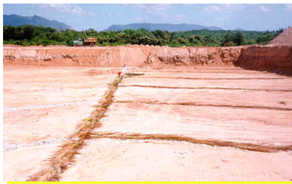
Figura 2 – preparação da drenagem tipo “espinha de peixe” em uma trincheira, no Aterro ASMOC.